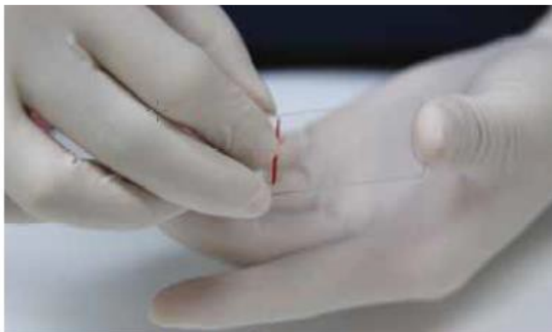
引きガラスによる塗抹法(図6)

液状検体で休日・連休により採取後すぐに出せない場合は、遠心したのち沈渣成分をスライドに塗布し、すぐに固定して翌平日に提出して下さい。